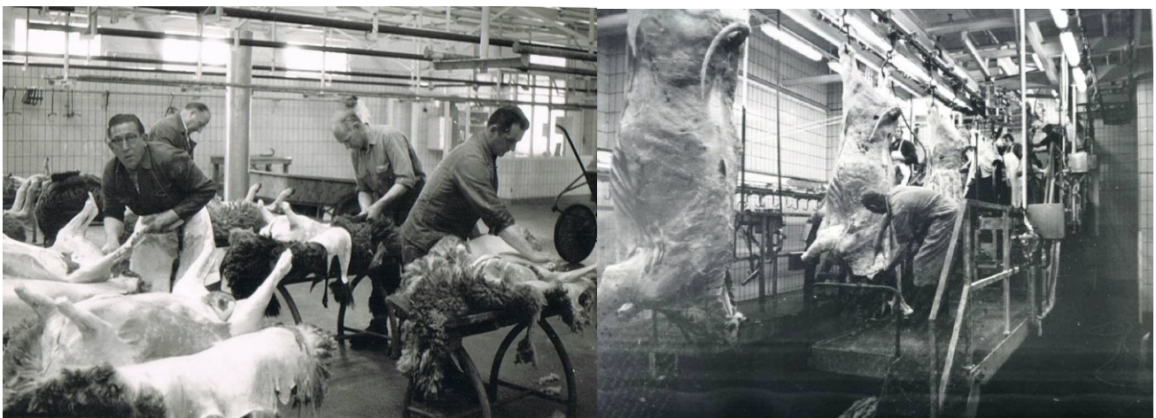
De Uitbeners 1970

Het Openbare Slachthuizen de Veemarkt hadden in 1953 te maken met inkomsten van f1.286.454.45 tegenover uitgaven van f1.096.474.70. Een winst van f189.979.75. In 1967 vermeldde een Commissie Slachthuis en Veemarkt Rotterdam, dat een deel van de gebouwen in een slechte staat verkeerde en de transportwegen niet voldeden aan de gestelde eisen. De sloop en de nieuwbouw zou volgens de Commissie een bedrag van naar schatting 80 miljoen kosten. Maar het slachthuis kwam ook op een ander manier in het nieuws. In 1970 kwam het nieuws naar buiten dat de moderne apparatuur in de verouderde gebouwen o.a. de veiligheid van de runderslachters ernstig bedreigde.